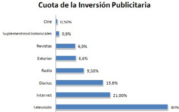
Grafico 1. Distribución del mercado de la publicidad de medios convencionales 2013