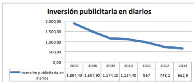
Gráfico 3. Evolución inversión publicitaria en diarios (en millones de euros)